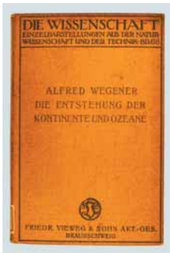
Die Entstehung der Kontinente und Ozeane の表紙